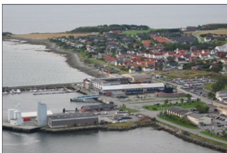
Brekstad Gjestebygge, foto fra nord.