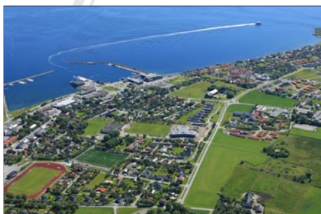
Brekstad Gjestebygge, foto fra vest.

Havneverten skal ha synlig merke, som for eksempel vest og lue, med tekst som viser "Havnevert Brekstad Gjestebygge". Havneverten skal se til at gjestene har den informasjonen de trenger om turistattraksjoner på Ørland og bidra til at de får et trivelig opphold på Brekstad, samt å kontrollere at gjestene har betalt avgiften.